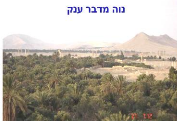
נוה מדבר ענק

לשיא כוחה והשפעתה הגיעה תדמור כמאתיים שנה אחרי חורבן בית שני, עת הפכה ללשון המאזנים במאבק האדירים שהתחולל בין האימפריה הרומאית לאימפריה הפרסית. מיקומה הגיאוגרפי על קו התפר שבין שתי המעצמות איפשר לה לתמרן בין המעצמות, ולהגדיל את כוחה על חשבונם. תדמור היתה נתונה בדרך כלל תחת חסות רומאית. חוץ מהערך הכלכלי שבה, ראו בה הרומאים בסיס קדמי להגנת האימפריה מפני אויביהם הפרתים- פרסים. בשלב מסוים השיגו בני תדמור עוצמה רבה שאיפשרה להם ליסד ממלכה עצמאית רחבת ידיים שהשתרעה ממצרים ועד אסיה הקטנה, וכללה בתחומה את כל ארץ ישראל.