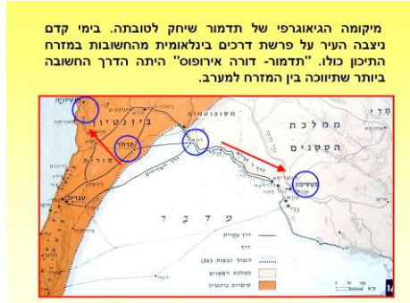
מיקומה הגיאוגרפי של תדמור שיחק לטובתה. בימי קדם ניצבה העיר על פרשת דרכים בינלאומית מהחשובות במזרח התיכון כולו. "תדמור- דורה אירופוס" היתה הדרך החשובה ביותר שתיכנה בין המזרח למערב.

תדמור שיחק לטובתה. בימי קדם ניצבה העיר על פרשת דרכים בינלאומית מהחשובות במזרח התיכון כולו. "תדמור- דורה אירופוס" היתה הדרך החשובה ביותר שתיכנה בין המזרח למערב. בדרך זו עברו העתיק, חלקן יקרות כל כך לרוכשן. סחורות יקרות הגיעו במזרח- במרחבי הממלכה באימפריה הרומית הגדולה. המדבר הגדול בדרכם מחופי הגדולות שבמזרח – בבל, פרס המדבר הענק הסובב את העיר כדי להחליף כוח ולהצטייד במזון ומים. הדרך הנוחה היחידה, שבה ניתן לחצות את המדבר עוברת בתדמור. הדרך סומנה ב"אבני מיל", לאורכה הקימו מגדלי שמירה ותצפית, ונכרו בורות מים לשיירות המהלכות בדרכה. שליטי העיר ניצלו היטב עובדה זו. המיסים הכבדים שהוטלו על שיירות המסחר ועוברי אורח הפכו את העיר למעצמה עשירה 3 .